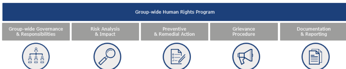
Gráfico 1: Los cinco componentes básicos de nuestro Programa de Derechos Humanos

Nuestra debida diligencia en materia de derechos humanos, para nuestras propias operaciones y cadenas de suministro, se basa en cinco pilares: